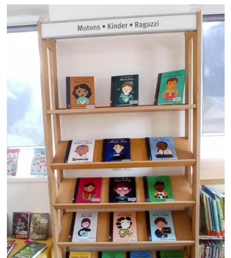
Ai mutons y ala mutans dla scola elementera ti al sapù drët nteressant a audi velch n cont de personaliteies che à mudà la storia.