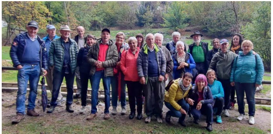
Die ehrenamtlichen Helfer des Sozialsprengels Gröden.

Möchten auch Sie mithelfen? Der Sozialsprengel Gröden freut sich immer über neue freiwillige Helfer. Bei Interesse können sich die Bürger gerne unter folgender Nummer dazu informieren 0471 798015.