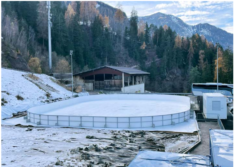
N possa inò jì cun i jadins via n Setil.

Per chël che reverda l Zënter dal tennis a Runcadic iel uni dat pro dal cunsèi dla Park Urtijèi l proiet de mascima laurà ora dal architèet Hannes Mahlknecht per renuvé l tèt dl fabricat y per adaté dut l fabricat, che ie uni fat su dan 36 ani, ala normatives atueles per la prevenzion dl meldefuech y per adaté l mplant eletrich ai bujëns de al didancuei. Dut chësc ie de bujëns per avèi inant l bënsté dl Chemun de Ciastel