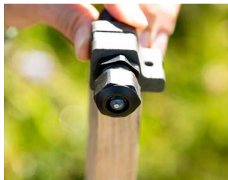
Il microfono del cosiddetto "bat logger" registra i suoni nella gamma ultrasonica, cioè i suoni dei pipistrelli.