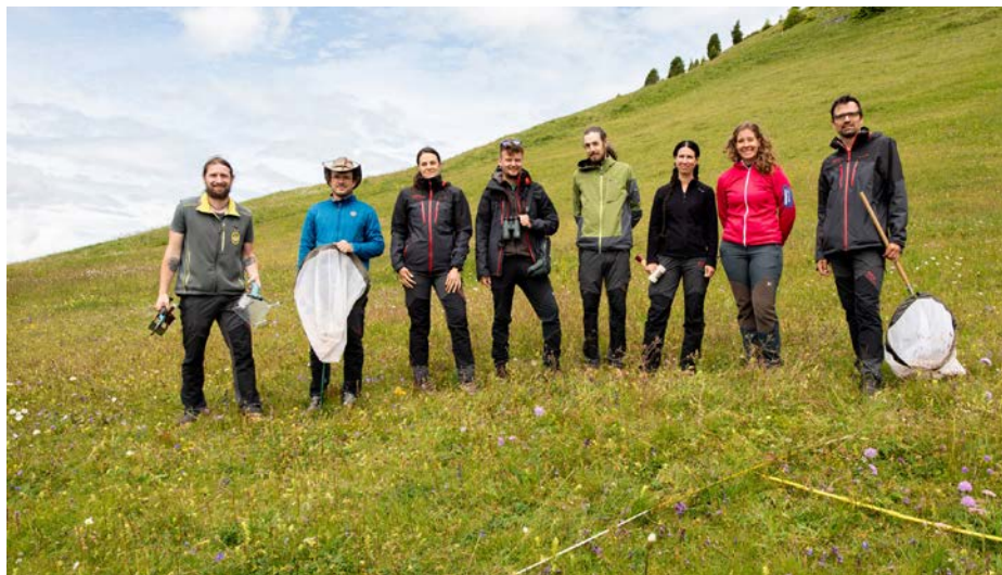
I ricercatori del Monitoraggio della Biodiversità Alto Adige sono in viaggio per tutto l'Alto Adige dal 2019. Quest'anno studieranno anche Ortisei.

Nell'ambito del Monitoraggio della Biodiversità in Alto Adige i ricercatori di Eurac Research stanno rilevando il patrimonio naturale provinciale. Nel 2023 saranno sul campo anche a Ortisei per studiare la flora e la fauna.