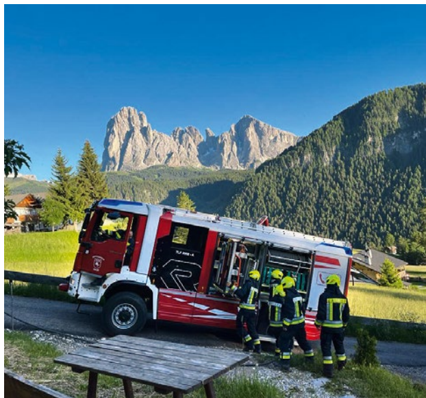
I destudafuech de Urtijëi mët a jì chëst ann la Segra de Urtijëi.

Ai 9 y 10 de lugio iela inò tan inant: I ie Segra a Urtijëi! Do doi ani che n ne à nia pudù la mèter a jì, sons cuntënc che chëst ann pudons inò jì a Segra.